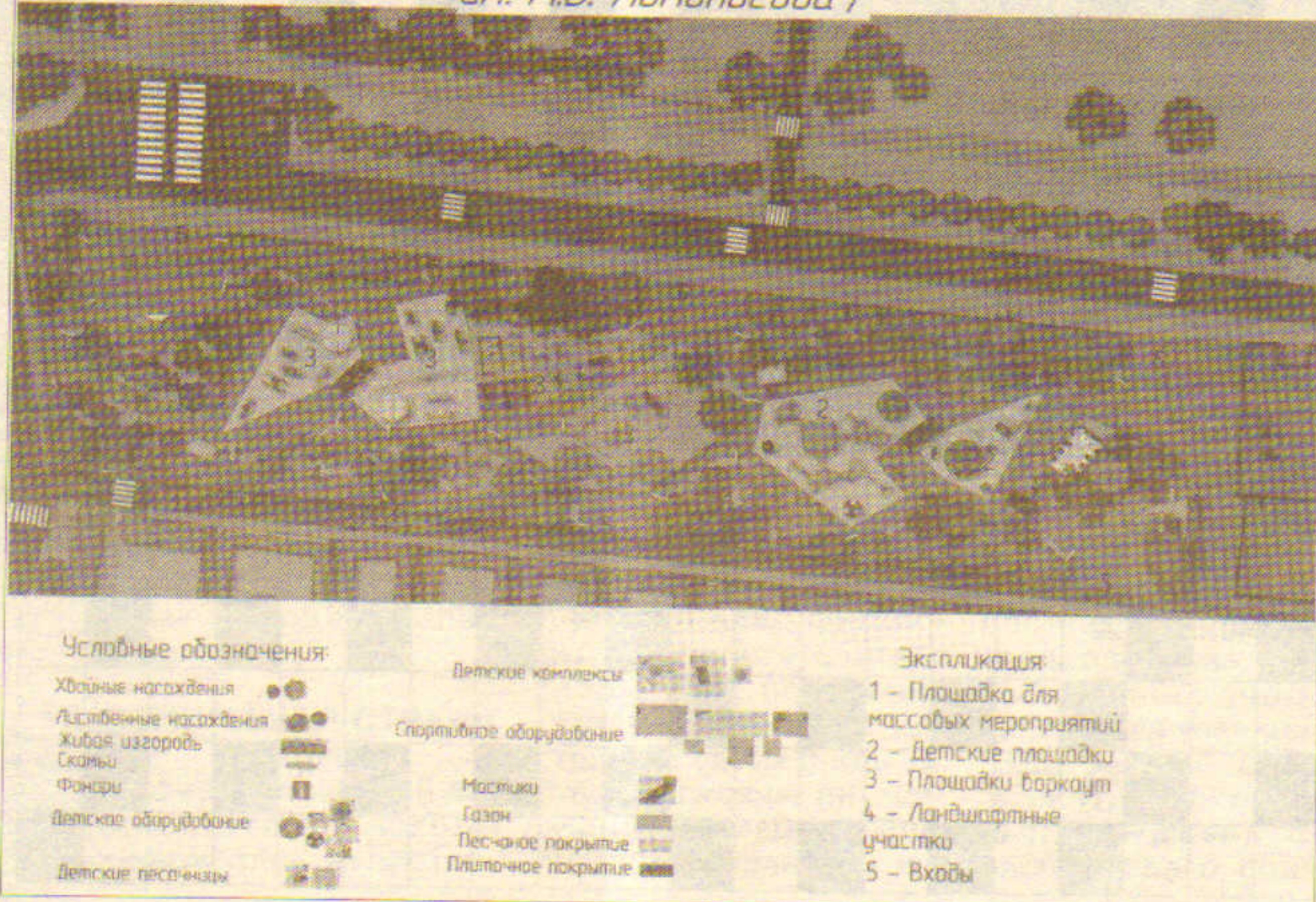
Благоустройство сквера по ул.Топорковская в г. Пугачёве Саратовской области (напротив МОУ «СОШ № 13 г. Пугачёва им. М.В. Ломоносова»)